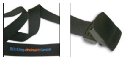
Gürtel Detailsicht (Neutral oder mit Kundenlogo.)

Elastischer schwarzer Gürtel; 100% Polyester; 38mm breit, Schließe- und Endstück aus PA 6.6; Länge: 90,100,110,120,130cm